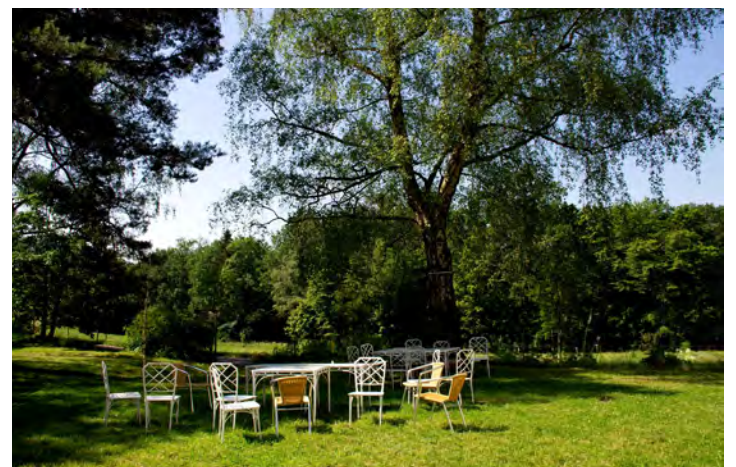
Außenfläche vor dem BildungsBau