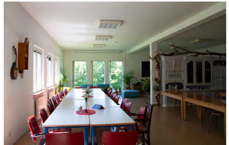
Speise- & Gemeinschaftsraum