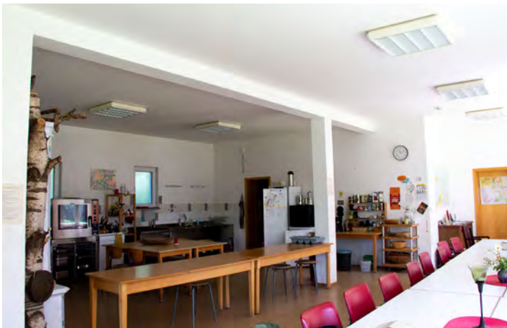
Küche & Speiseraum